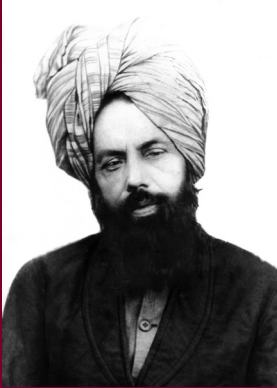
حضرت میرزا غلام احمد قادیانی امام مهدی و مسیح موعود علیه السلام

This is the persian translation of the Keynote Address delivered by Hadhrat Mirza Masroor Ahmad ABA , Khalifat-ul-Masih V, Head of the Worldwide Ahmadiyya Muslim Community at the 18th National Peace Symposium hosted by the Ahmadiyya Muslim Community UK., on 9th March 2024.