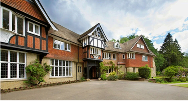
دانشگاه احمدیه انگلستان

جماعت احمدیه جهت آموزش دین اسلام اقدام به تأسیس دانشگاه های متعددی جهت آموزش دین در چندین کشور نموده است از جمله؛ پاکستان، هند، کانادا، انگلستان، آلمان، غنا و سیرالئون. طول مدت تحصیل هفت سال می باشد. پذیرفته شدگان پس از کسب آمادگی در امر تبلیغ دین، به نقاط مختلف جهان فرستاده می شوند تا پیام احمدیه را به آن نقاط برسانند.