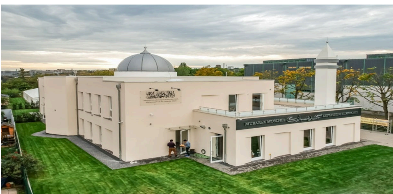
مسجد مبارک ویسبادن، آلمان