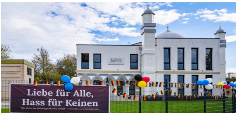
مسجد بیت الحمید فولدا، آلمان