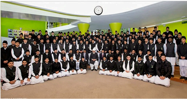
دانشجویان دانشگاه احمدیه انگلستان