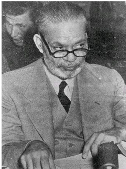
محمد ظفرالله خان رضی الله عنه

■ پروفیسور محمد عبدالسلام رحمه الله، برنده جایزه نوبل فیزیک در ۱۹۷۹ میلادی